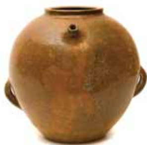
Vrč z »noskom« brez ročaja ali z njim. Glazirani so samo znotraj ali v celoti. Vrče so uporabljali za shranjevanje vode, jabolčnega ali vinskega kisa. Hrani Muzej Ribnica.

Ko je bila posoda prvič ožgana, jo je lončar še »pocinil« ali glaziral z glajenko. Glajenka je belkast prah, svinčev oksid, ki so ga razredčili z vodo. Posodo je oblival z glajenko s pomočjo zajemalke. Notranji del lonca je glaziral tako, da je vanj natočil malo glajenke in lonec premikali sem ter tja, da je bil od znotraj lepo oblit. Ostanek pa je izlil. Če je uporabil samo svinčeno glajenko, je bila posoda rumene oziroma rdečkaste barve, odvisno od barve gline. Zeleno glazuro je dobil, če je glajenki dodal še »kotlovino« (bakrov oksid), rjavo pa, če je glajenki dodal železov oksid. Po dveh urah se je glazura posušila in lončenino