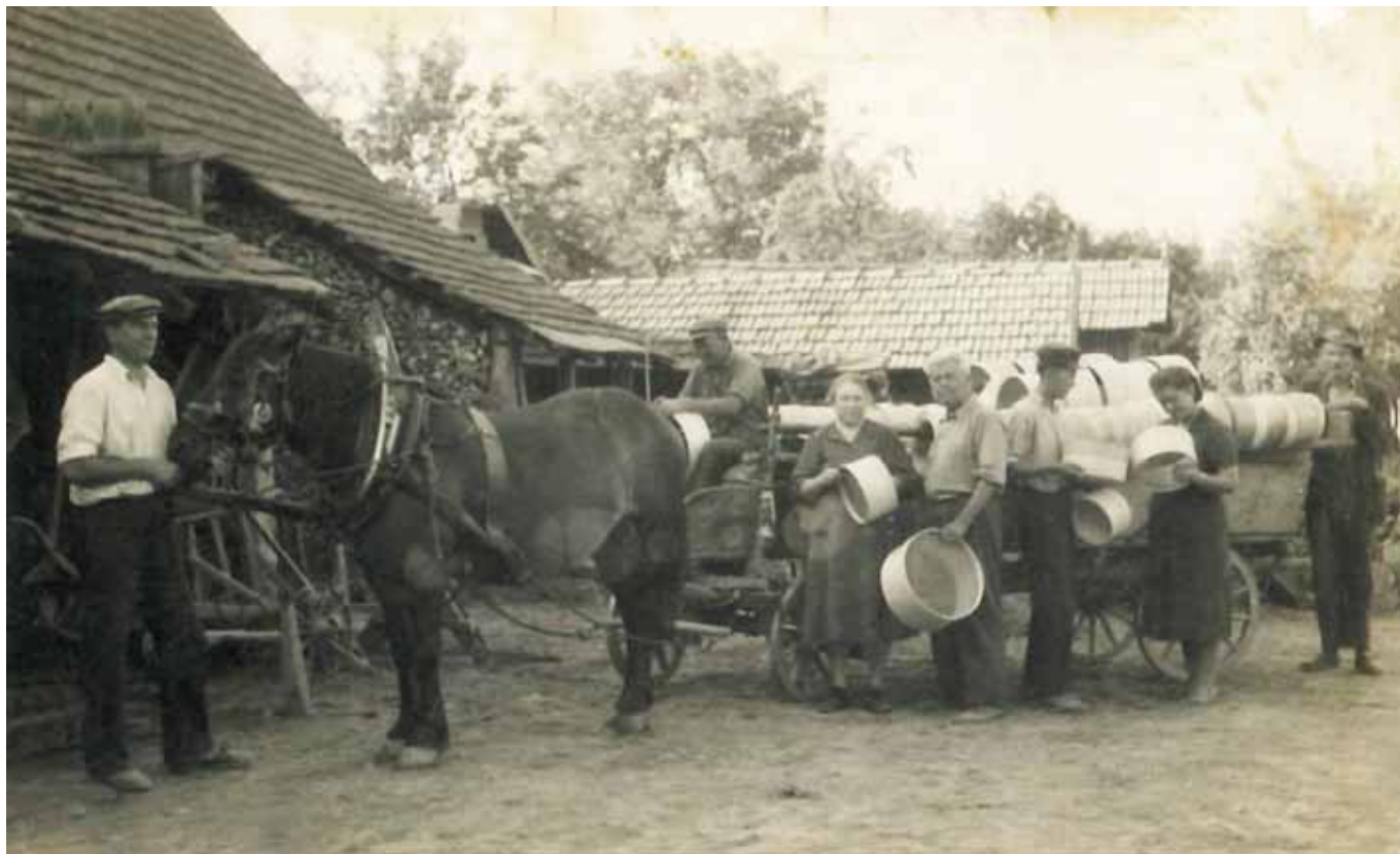
Šilc Franc - Čanžkov (na vozu) iz Dolenje vasi 8, leta 1956, ko je z vozom - šinarjem zdomal s suho robo vse do Hrvaške Slavonije. Slika je nastala na Hrvaškem, ko so prodajali sita tamkajšnjim gospodarjem in gospodinjam.