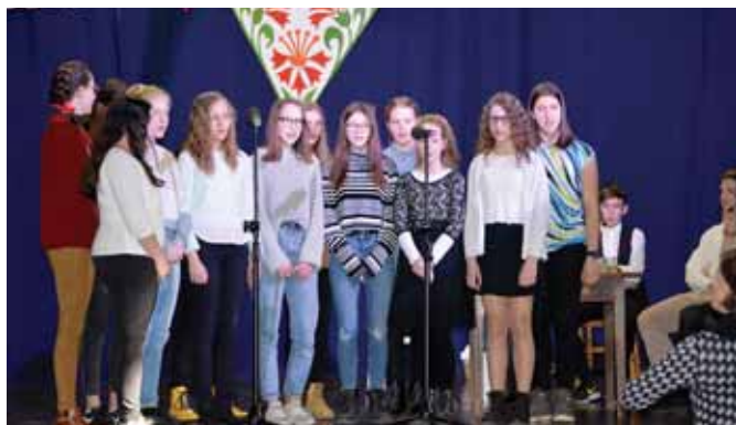
Komorni pevski zbor je zapel Pod rožnato planino