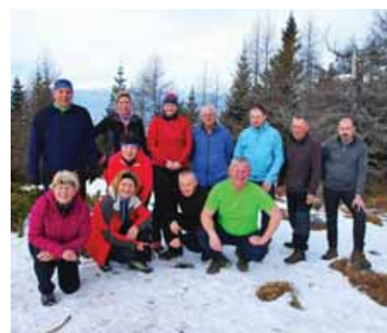
Na vrhu Dobrče.