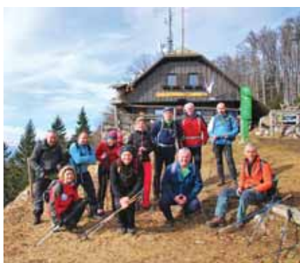
Pred planinsko kočjo na Dobrči.