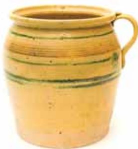
Lonec – »šporhetar« ima 1–2 ročaja. Glaziran je znotraj in zunaj. Uporabljali so ga za kuhanje ter shranjevanje hrane. V njem so kuhali tudi na štedilniku. Hrani Muzej Ribnica.