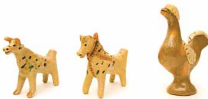
Glinene piščali v obliki krave in konjčka ter in figura v obliki petelina. Hrani Muzej Ribnica.

je bilo treba še enkrat žgati. Zelo pomembno je bilo, da je bila posoda žgana pri visoki temperaturi, saj je vsebovala svinec, ki se je moral v peči dobro sežgati. Če lončar glazirane posode ni dovolj žgal, je lahko bil svinec, ki je ostal v glazuri, za ljudi tudi smrtno nevaren. Pred drugo svetovno vojno je 1 kg glajenke stal 16 din, za eno lončarsko peč so je potrebovali 10–15 kg.