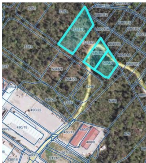
prikaz nepremičnin iz PISO