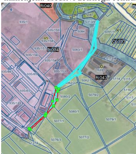
Geografski prikaz PISO (ukinitve javnega dobra)

V naravi po delu parcele poteka občinska cesta javna pot odsek JP 853691 Šeškova – Č. N. - Ul. Talcev, vendar ne po delu, za katerega je predlagana ukinitve javnega dobra. Ta del ni namenjen splošni rabi, torej kot javno dobro ne služi svojemu namenu. Po izvedbi parcelacije se bosta predmetni del zemljišča parcela 5308/3 in zemljišče parcela 5076/3, obe k.o. 1626 Goriča vas zamenjala za zemljišča parcela 5080/1-del, 5080/2-del, 5082/1, 5082/2-del, 5079/2 in 5079/1-del, vse k.o. 1626 Goriča vas, ki bodo kot že navedeno namenjena ureditvi zbirnega centra.