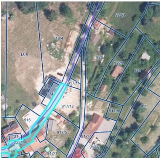
Geografski prikaz PISO potev vodovoda